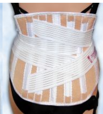
Bederní pás s pevným vedením bederní páteře