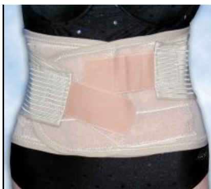
Kýlní pás břišní elastický