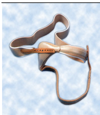
Kýlní pás tříselný