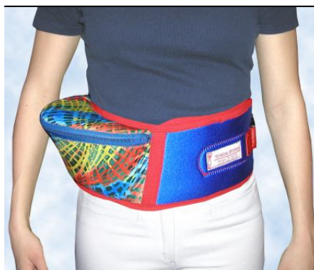
Ledvinka pro usnadnění nošení malých dětí