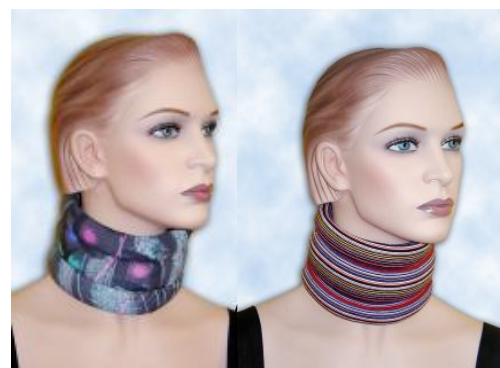
Krční límec měkká bandáž fixační nebo stabilizační