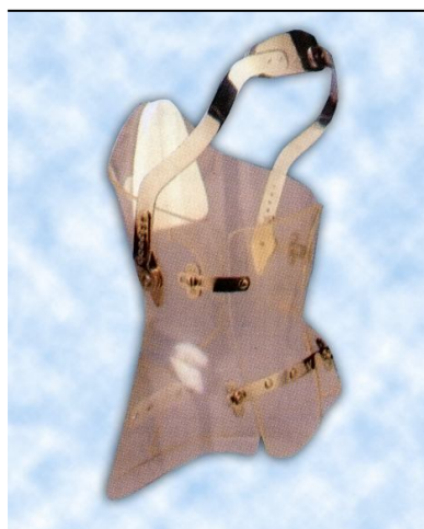
Antikyfózní spinální ortéza