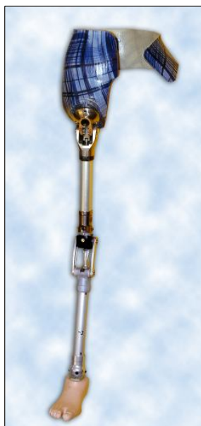
Protéza dolní končetiny po exartikulaci v kyčelním kloubu.