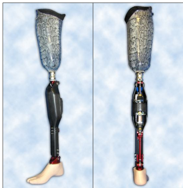
Protéza stehenní s kolenním kloubem HYDRACADENCE