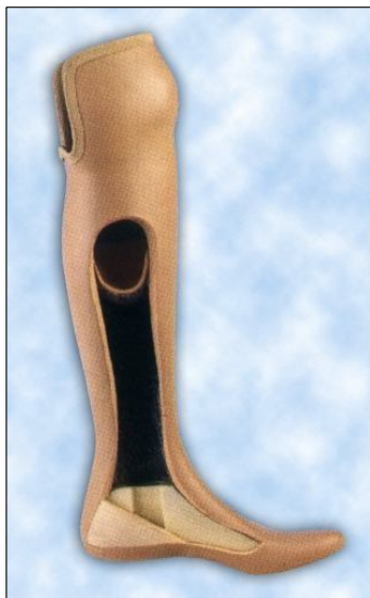
Protéza bérková s chodidlem 3P složená ze tří prvků z polyuretanové pěny a pryskyřice