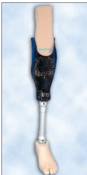
Protéza bérková uhlíková